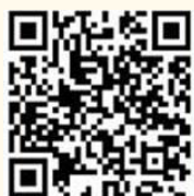
英威达招聘二维码