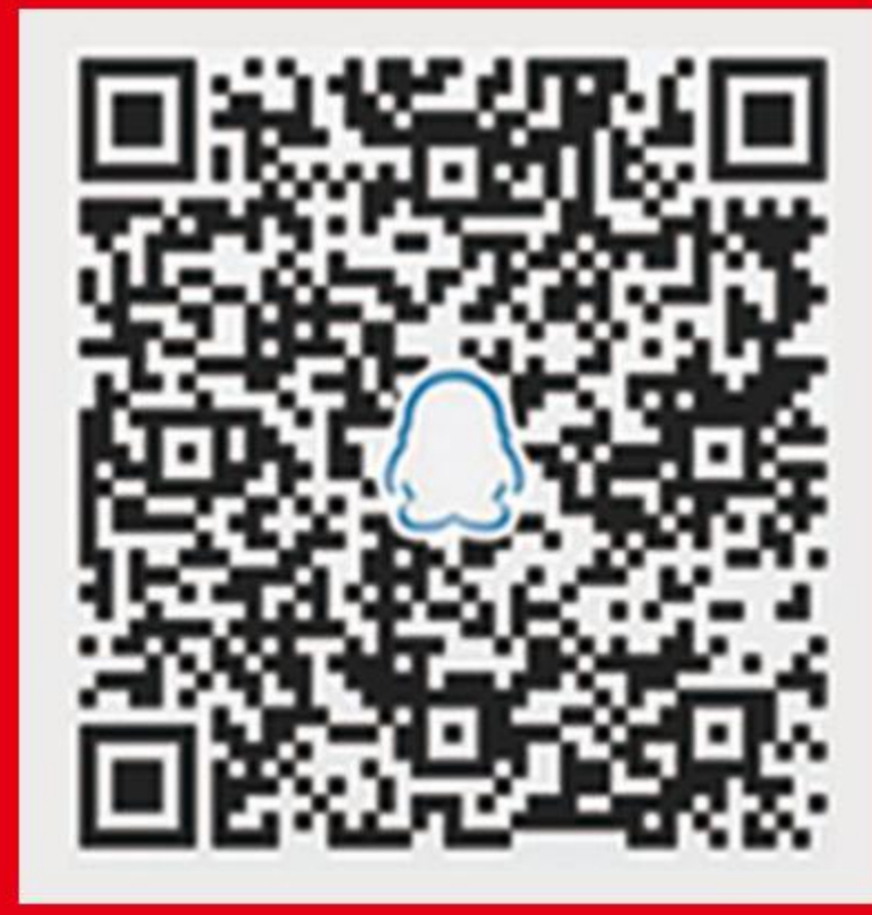
群官方招生咨询QQ群