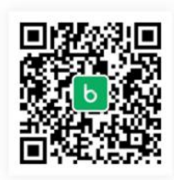
步道乐跑微信公众号

直接扫描下载 关注“步道乐跑”微信公众号 苹果 APP Store 各大安卓市场直接搜索“步道乐跑”