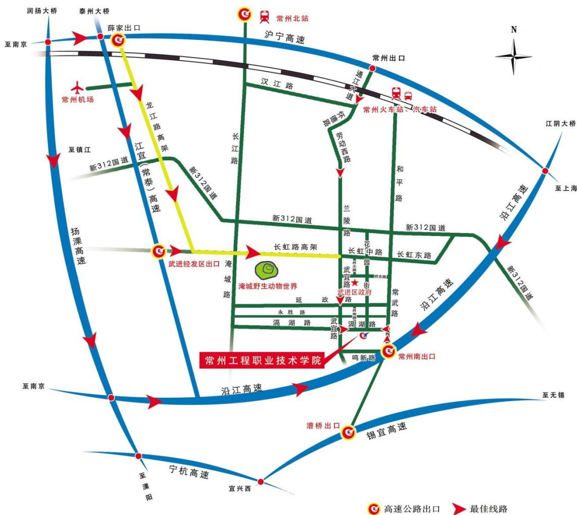
常州工程职业技术学院周边交通示意图

(1) 沪宁高速薛家出口下，从市区方向直接上龙江高架快速路到和平南路（常武路）出口下，右转上常武路，直行约 1 公里右转至溇湖中路，继续直行约 2 公里到达学院。